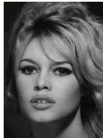
Brigitte Anne-Marie Bardot (f.1934). Levande modeller för det s.k. "Babyface-ansiktet" är t ex Brigitte Bardot och Kate Moss.

Bilden av en animerad kvinnogestalt med stora, runda ögon, en hög välvd panna och en liten, kort näsa och haka bedömdes ha mest attraktionskraft. Denna bild har benämnts som babyface-ansiktet. Endast ett fåtal om ca 10 % bedömer ett ursprungligt vuxet ickeanimerat och riktigt ansikte mer attraktivt. De flesta försökspersoner (90%) föredrog m a o ansikten som inte existerar i verkligheten med 10% -50% förvrängning av proportionerna i babyface systemet. Detta innebär att även de mest attraktiva kvinnliga ansikten kan animeras till en högre attraktivitetsgrad där deras verkliga proportioner förändras mot mer babyface-likhet. Det måste uttryckligen anges att inte bara män utan även kvinnliga försökspersoner fann dessa förvrängda babyface-bilder mer attraktiva, och att forskarna inte kunde iaktta någon inneboende preferens babyface-bilder hos manliga försökspersoner. Naturliga ansikten kunde inte alls hålla jämna steg med sina konstgjorda konkurrenter. 70% av alla fysiskt verkliga kvinnliga ansikten och 79% av alla verkliga manliga ansikten bedömdes som "ointressant", "ganska oattraktiv" eller "mycket